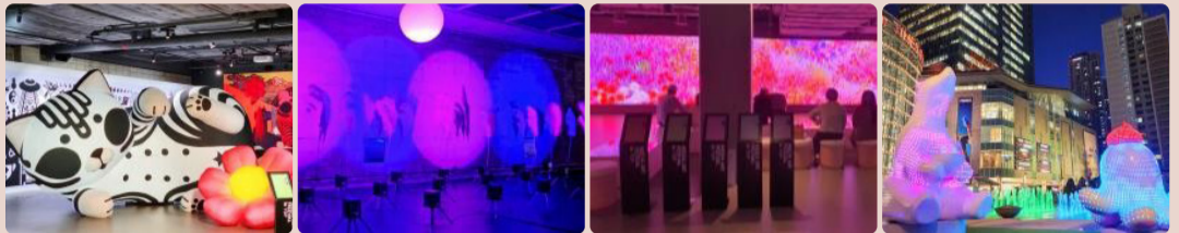
조세민, 봄을 맞이한 달리와 함께 느껴보는 봄 <꽃과 나비인 달리>